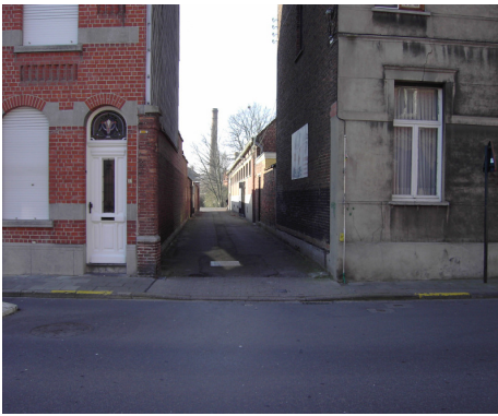
ingang naar de parking